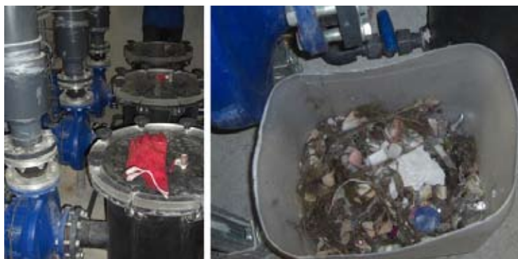
Les pompes (gauche) et déchets récupérés sur les filtres

Deux pompes en service, extraient l'eau du bassin tampon vers les étapes de traitements. Elles sont équipées de filtres permettant de récupérer les débris solides issus des baigneurs.