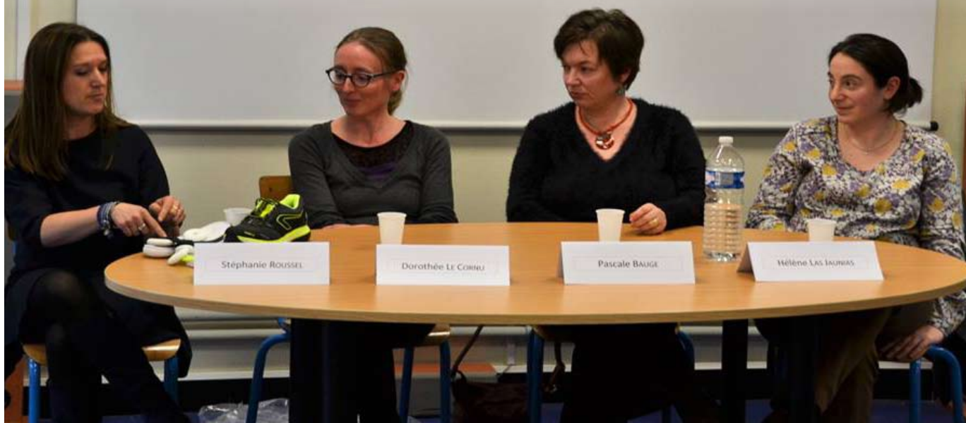
TABLE RONDE: Ingénieurs au féminin

Le vendredi 17 mars, les étudiantes de 1 ère année de CPGE, lycéennes de premières et de terminales du Lycée Sainte-Marie ont été invitées à participer à une table ronde sur le sujet : “Ingénieurs au féminin”.