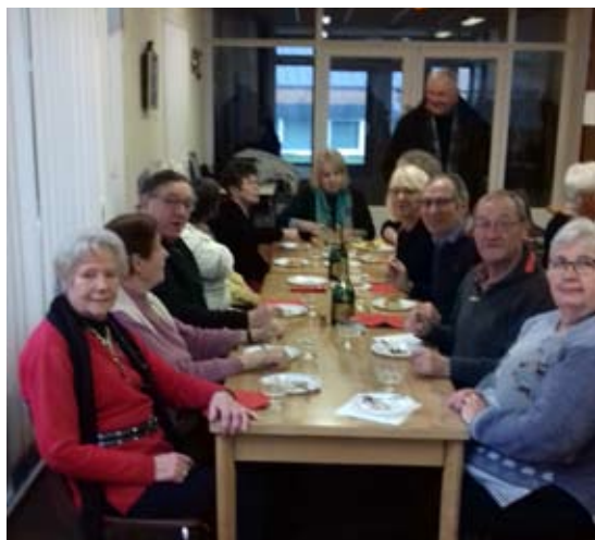
Jeudi 20 décembre, salle des fêtes, a eu lieu le repas de Noël du club RENAISSANCE.