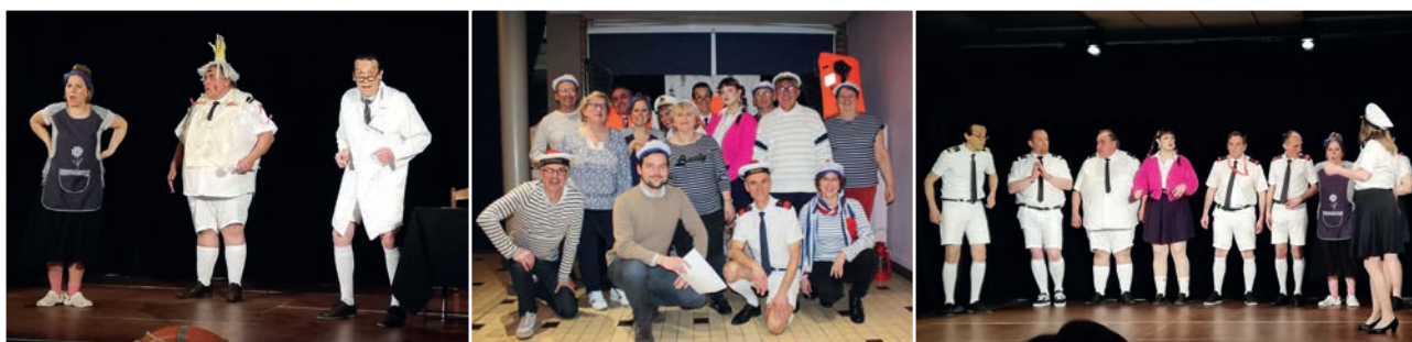
L'équipe du comité des Fêtes et la troupe des Grommelos